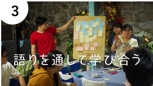
語りを通して学び合う