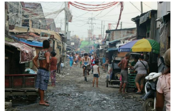
2日目はこんな都市スラムを訪問。住民の方にお話を聞いたり、子どもたちと遊んだりします。

※マンスリー・サポーターは、月額1,000円からの継続的なご寄付で、アクセスの活動をご支援いただく仕組みです。ツアー申込時にマンスリー・サポーターのお手続き方法をご案内します。ツアー参加にあたっては、入会から3カ月間のご支援継続をお願いします。4か月目以降、いつでも簡単に退会いただけます。 ※お申込時にすでにマンスリー・サポーターになっていただいている方は、追加のお手続きは必要ありません。