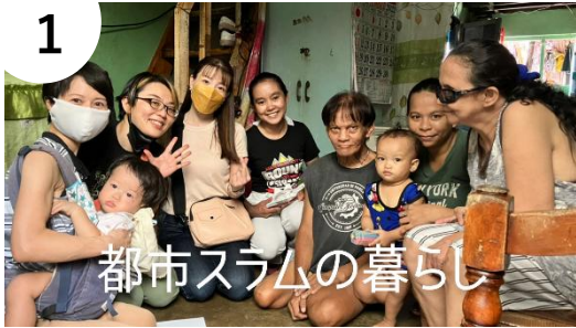
都市スラムの暮らし